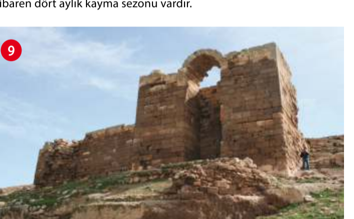
ÇİMDİN KALE (ÇİMDİN KALE-ESKİ KALE) Şanlıurfa-Viranşehir karayolunun 61.km'sinden güneye saparak 9 km'lik bir mesafeden sonra ulaşılabilir tarihi bir kaledir. Etrafı derin savunma hendesi ile çevrili bu kalenin, Eyyubiler Döneminde yapıldığı tahmin edilmektedir. Yapıda bir türbe mevcuttur. Türbe kitabesinde Peygamber soyundan İbrahim oğlu Mesut Ali'nin kabri olduğu yazılır. Çimdin Kalem'in batıdaki girişinde büyük mağaralar yer alır. Memlükler Döneminde restore edilen kale üzerinde bir de su kuyusu bulunur.