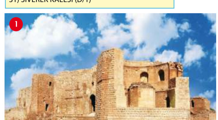
HARRAN KALESİ Harran Kalesi, şehrin güneydoğusunda şehir suruna bitişik olarak inşa edilmiştir. İslami kaynaklarda kalenin yerinde bir Sabii tapınağının bulunduğundan habesindedir. Enevi halfesi II. Mervan'ın 10 milyon dirhem altın harçyarak yaptırdığı sarayın, kalenin esasını oluşturduğuna tahmin edilmektedir. 90x130 metre boyutlarındaki kale üç katlıdır. Düzensiz dikdörtgen planındaki kalenin dört köşesinde onikişer birer kule bulunmaktadır.