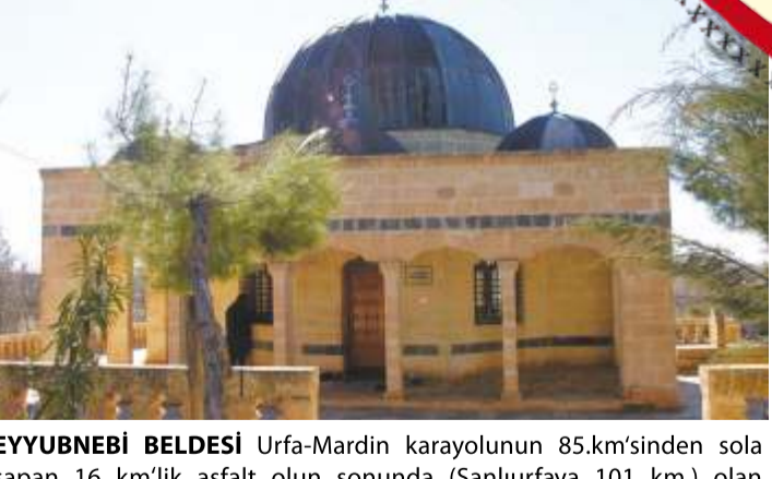
EYYUBNEBİ BELDESİ Urfa-Mardin karayolunun 85.km'sinden sola sapan 16 km'lik asfalt olan sonunda (Şanlıurfa'ya 101 km) olan Eyyubnebi Beldesine varılır. Burada, Hz. Eyyub (a.s.) ve eşi Hz. Rahime'nin türbeleri ve Hz. Eyyub'u görmeye gelen Hz. Elyesa (a.s.) Peygamberin türbeleri bulunmaktadır. Bu belde'nin 400 yıldan beri Eyyubnebi adıyla anıldığı vakfyesinden anlaşılmaktadır. Yüzlerce yıldır bilhassa dini bayramlarda ve arife günlerinde bu mezarlar binlerce kişi tarafından ziyaret edilmektedir. Efsaneye göre, Hz. Eyyub'ın otururken sırtı dayadığına inanılan büyük bir bazalt taşı ise, "Sabir Taşı" olarak bilinir ve ziyaret edilir. Hz. Eyyub (a.s.), Urfa'da şifa bulduktan sonra Eyyubnebi Beldesine geri dönmüştür. Burada uzun süre yaşamış mal, mülik ve evlat sahibi olmuştur. İmtihan öncesi sahip olduğu zenginliği fazlasıyla sahip olmuştur. Hz. Eyyub (a.s.), vefat edince Eyyubnebi Beldesine defnedilmiştir. Günlük diğrındaki ikinci makam, Hz. Eyyub (a.s.) 'un Hamam Hz. Rahime'nin türbesi olarak ziyaret edilmektedir. Rivayete göre; Hz. Eyyub (a.s.)'un çağdaşı olan Hz. Elyesa (a.s.), Hz. Eyyub (a.s.)'u görmek için Eyyubnebi Köyüne vardığında, buluşmaya ramak kala oracıkta vefat eder. Makamı, Hz. Eyyub'un Türbesine 500 metre mesafededir.