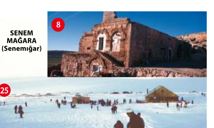
KARACADAĞ KAYAK MERKEZİ Siverek ilçemizde yer alan Karacadağ'da bölgenin kar tutabilmesi özelliğinden yola çıkılarak Vâlik tarafından kayak pistleri düzenlenmiştir. 600-700 m. uzunluğunda pistler için 250m'lik bir lift yapılmıştır. Siverek ilçesinde 60 km. mesafede olan kayak merkezinde 60m'lik bir kaleterya ile 30m'lik bungalov tipi hizmet evi bulunmaktadır. Kasım ayında itibaren dört aylık kayak sezonu vardır.