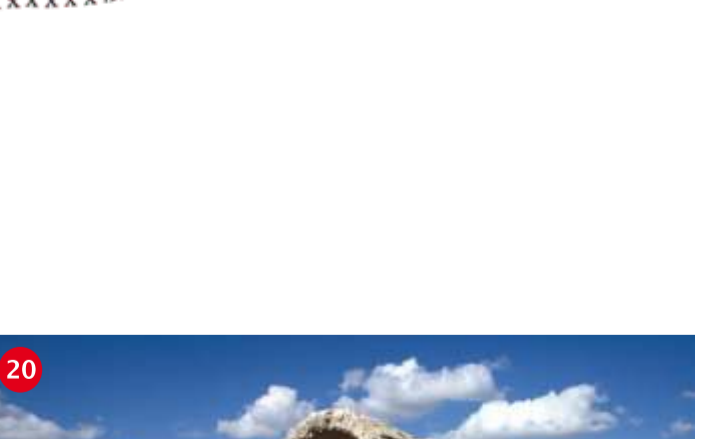
DEYR YAKUB (YAKUB MANASTIRI) Merkeze 10 km. uzaklıktadır. Hz. İbrahim Peygamber'in mücadele ettiği Kral Nemrut'un burayı sığındığı olarak kullanıldığına inanılır. Alında manastır olan yapı için, halk arasında Nemrut'un Tahta ya da Çin Değirmeni ifadeleri kullanılır. Manastırın kuzeybatısındaki ant mezarlık kitabede Şardu Bar Manu'nun karnısı Amaşşemes yazıldığı. Yazıt ve yapı 2-3. yy. ye tarihlenmektedir.