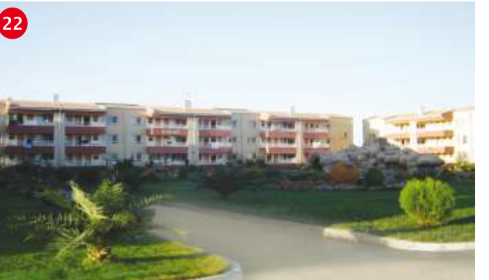
KARAALI KAPLICALARI Şanlıurfa'nın 40 km. güneydoğusunda bulunan Karaali Kaplıcalarında, Kaplıca Otel Tesisi'ni ve Kapalı Havuz Tesisi'ni Özel İdare tarafından yapılmış olup 34 odalı 60 yataklıdır. 150.000m 2 'saat sıcak su kapasitesidir. 54 daireden oluşan bir apart otel de Şubat 2000 'de hizmete açılmıştır. 49-55 derecedeki sıcak suyun, sinir sistemi, eklem, cilt, dolayım ve benzeri hastalıklar için şifa özelliği taşıdığı tespit edilmiştir. Karaali Kaplıcaları, kaplıca turizmi dışında seracılık amaçlı da kullanılmaktadır.