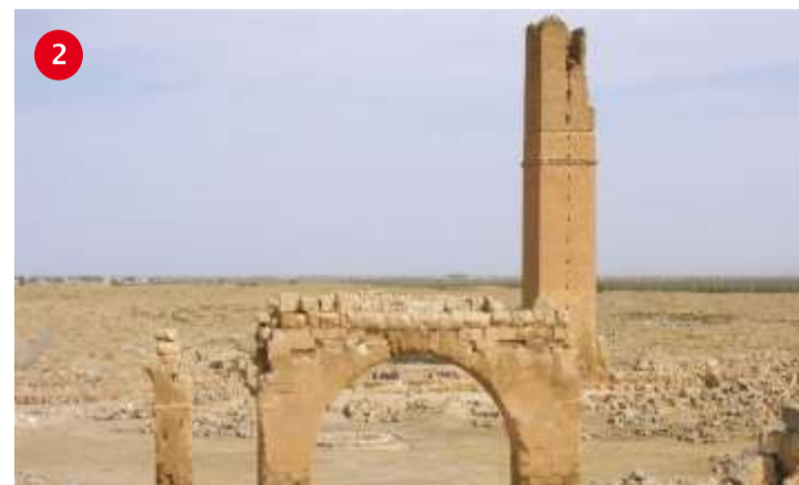
HARRAN ULU CAMİİ Harran, MS 639 yıllarında Halife Hz. Ömer zamanında İslam hâkimiyetine geçmiştir. Harran, Emevîler Dönemi'nde son halife II. Mervan zamanında da bir süre başkent olmuştur. Türkiye'de İslam mimarisinde yapılmış en eski cami olan Harran Ulu Camii, MS 744-750 tarihleri arasında Emevîler Devri'nde Halife II. Mervan tarafından yaptırılmıştır. Minarenin zaman içinde yok olan aşşap merdivenleri, aslına uygun bir şekilde 105 basamaklı olarak yeniden yapılmıştır. Bu alanda bulunan Harran Okulunda yetişen alimler, Avrupa medeniyetinin oluşumuna büyük katkı sağlamıştır.