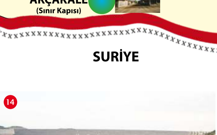
TÜRKİYENİN GURURU ATATÜRK BARAJI Baraj projesi 1960 yılında başlar, 10 Ocak 1991 tarihinde tamamlanır. Haziran 1992'de ise elektrik üretimine geçilir ve Harran Ovasını sulamaya başlar. Bunun neticesinde 2 yıldı 1 ürün alınan bu bereketli topraklardan yılda 2 ürün alınmaya başlanmıştır. Atatürk Barajı gövde dolguşu bakımından dünya 6.sı; Türkiye'nin ise en büyük barajıdır. Turizme olumlu katkı sağlayan bu hayati proje kapsamında baraj gölünde, yelken, kano, yüzme gibi birçok su sporuna yönelik organizasyonlar yapılabilmektedir.