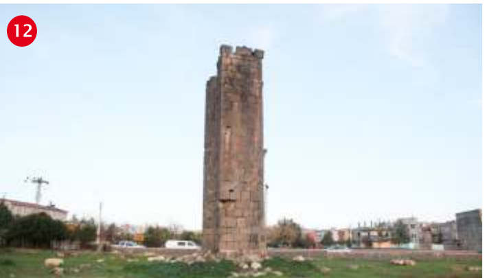
TELLA MARTYRİONU (Dikmeler) Viranşehir'de Eski Paşalar Okulunun batısında yer alır. Sekizgen yapının 4-5 ypled bir Aziz anısına Martyrion olarak inşa edildiği tahmin edilmektedir. Tamamı 8 adet olan dikmelerden bu güne sadece bir tanesi gelebilmiştir.