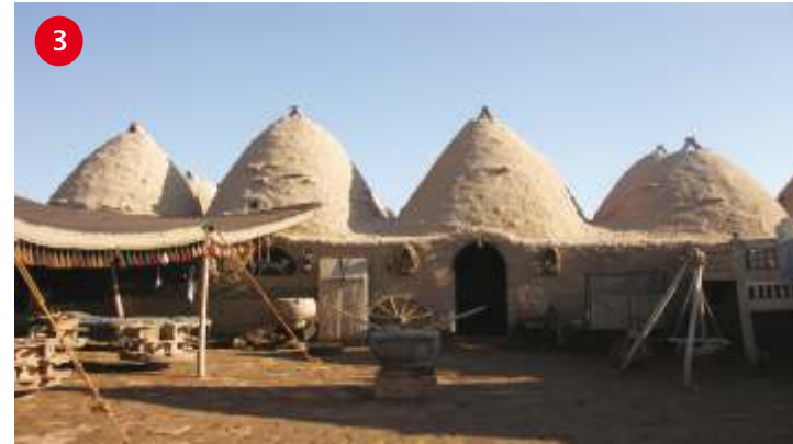
HARRAN KÜMBET EVLERİ Harran evlerinin benzerlerine Şanlıurfa'ya bağlı Süruç ve Birecik kırsalında köylerde de rastlamak mümkündür. Ancak, Harran'da farklı olarak, evlerin üst örtüsünde tuğla kullanılmıştır. Bunun ilk sebebi vardır: Biri, ağaç malzemenin bulunmaması, diğeri ise, Harran'da bol miktarda bulunan tuğla malzemesidir. Evlerin yükseliği içerden en çok 5 metreye ulaşır. Örgüleri düzensiz bir şekilde balık sıva ile bağlanan üst örtü ve duvarlar, içerden ve dışardan yine bu harçla süslenmiştir. Harran evleri yazın serin kışın sıcaktır. Sur içinde 600 kadar kümbet evi bulunmaktadır.