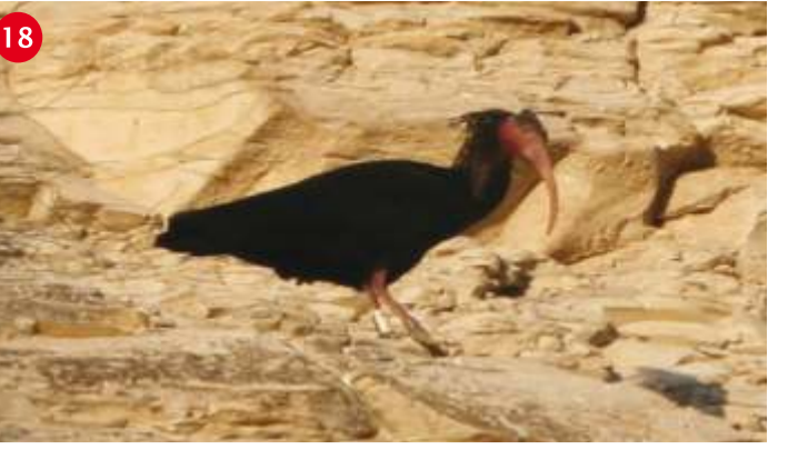
BİRECİK ve KELAYNAKLAR 1956'da Fırat üzerine Türkiye'nin en uzun köprülerinden biri olan Birecik Köprüsü'nün yapılması ile ilçe, yeniden gelişmeye başladı. Birecik, kelaynak kuşlarının göç merkezi olması dolayısı ile önemli bir yerdir. Kelaynak, dünyada sadece Birecik ve Kuzey Afrika'ya örnek için geçen, göçmen kuş türüdür. Kelaynaklar, şubat ortalarında Birecik'e gelip temmuz ortalarında yavrularıyla birlikte Birecik'ten ayrılırlar. Çeşitli nedenlerden dolayı, sayıları azalınca, 1977 yılında Orman Genel Müdürlüğü tarafından kurulan "Kelaynak Üretim ve Koruma İstasyonu"nda koruma altına alınmışlardır.