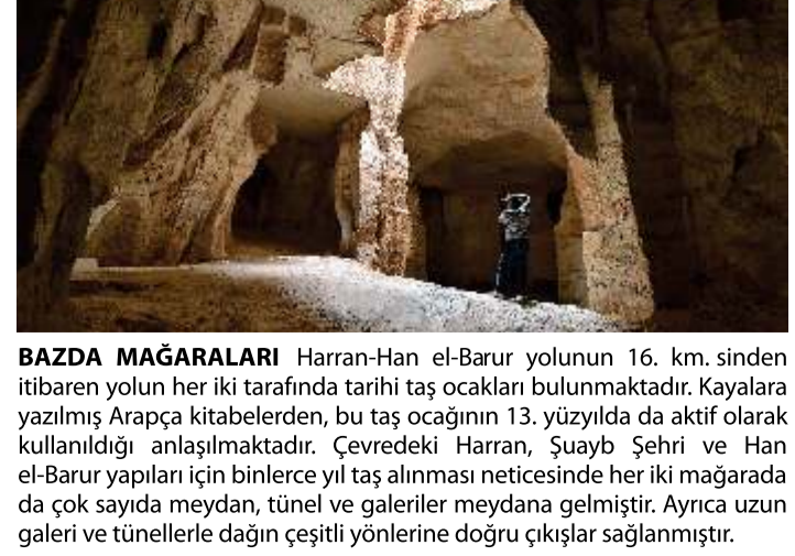
BAZDA MAĞARALARI Harran-Hon el-Barur yolunun 16. km. sinden itibaren yolun her iki tarafında tarihi taş ocakları bulunmaktadır. Kayalarla yazılmış Arapça kitabelerden, bu taş ocağının 13. yüzyılda da aktif olarak kullanıldığı anlaşılmaktadır. Çevredeki Harran, Şuayb Şehri ve Han el-Barur yapıları için binlerce yıl taş alınması neticesinde her iki mağarada da çok sayıda meydan, tünel ve galeriler meydana gelmiştir. Ayrıca uzun galeri ve tünellerle dağın çeşitli yönlerine doğru çıkartılar sağlanmıştır.