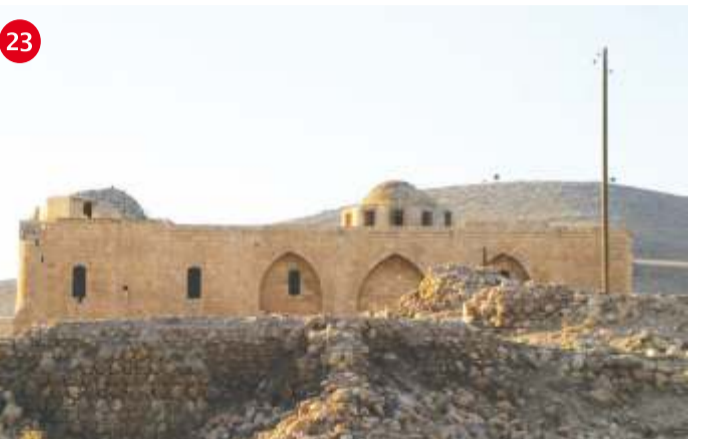
GERMUŞ KİLİSESİ Germuş Kilisesi, merkezin 10 km kuzeydoğusunda Germuş Köyü/Dağteşininde yer alır. 19.yy'de yapıldığı tahmin edilmektedir. Kilise alanı, bir akarsu, bir kilise (Aziz Yakup Kilisesi) ve kilisenin toplandı meydanından oluşur. Kilise, taştan ve iki katlı olarak inşa edilmiştir.