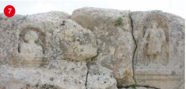
SOĞMATAR ANTIK ŞEHİRİ Şuayb Antik Şehrinden 18 km. sonra, Soğmatar Antik Şehrine varılır. Harran'a 57 km. mesafededir. Roma Dönemi'ne (MS 2. yüzyıl) tarihlenen bölge, Abgar Krallığı Döneminde Harranlıların ay ve gezegen tanımları için tapındıkları bir kilt merkezidir. Soğmatara; Ay tanrısı Sine ait mağara (Pognon Mağarası), yağmarda yapı ve taşın kabartmalarını ve zemine kazılmış yazıtları olduğu bir tepe (Kutsal Tepe), 6 adet kare ve yuvarlak planlı mozaik (Anıt Mezar), 4 kule ve en ana kayaya oyulmuş kaya mezarları bulunmaktadır. Soğmatar Antik Şehrindeki tarihi kuyunun, Hz. Musa Kuyusu olduğu rivayet edilir.