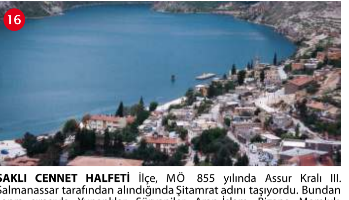
SAKLI CENNET HALFETİ İlçe, MÖ 855 yılında Assur Kralı III. Salmanssar tarafından alındığında Şitamrat adını taşıyordu. Bundan sonra sırasıyla; Yunanlılar, Süryaniler, Arap-İslam, Bizans, Memluk, Osmanlı hâkimiyetine girmiştir. İlçenin büyük bir kısmı Birecik Barajı suları altında kalmıştır. Kentin simgesi siyah güllü büyük ilği çekmektedir. Teknelere, Aziz Nerses Kilisesi'nin, Barşama Manastırı'nın ve daha birçok tarihi yapının yer aldığı Rumkaleye, kaya kilisesinin yer aldığı tarihi Savaşan Köyü'ne ulaşım olanaklı hale gelmiştir.